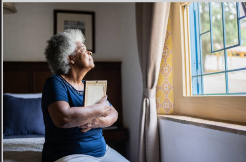
Image d'une veuve

La Journée mondiale des veuves est célébrée chaque 23 juin. Elle rappelle une réalité trop souvent reléguée au second plan, celle des milliers de femmes qui, après la perte de leur époux, doivent affronter seules un monde souvent dur, injuste et silencieux à leur douleur. Si le deuil est universel, la condition de la veuve au Togo reste marquée par des pratiques, des privations et un abandon qui compromettent gravement son bien-être, notamment sa santé physique et mentale.