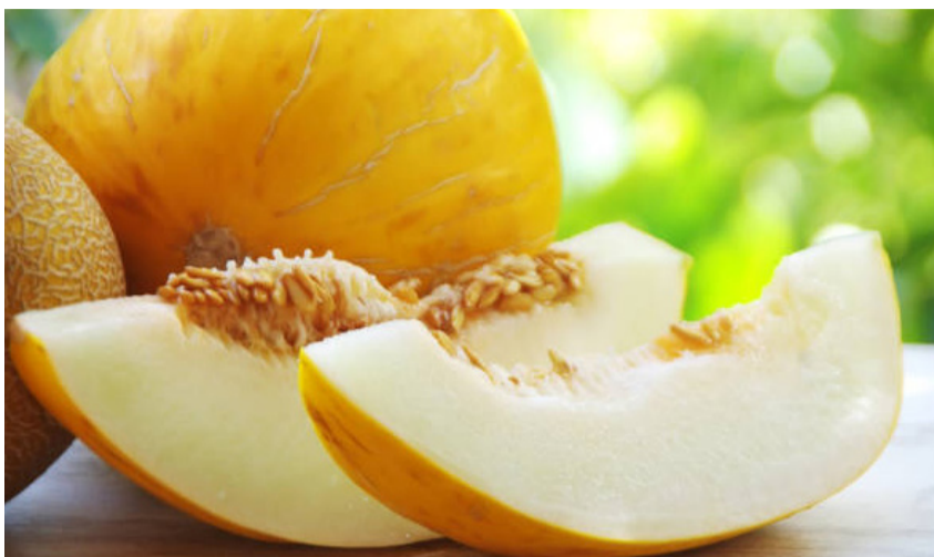
Image des melons

Le melon est riche en fibres solubles qui jouent un rôle très important dans l'hygiène du colon. Les fibres solubles absorbent l'eau en traversant le système digestif, ont effet de constituer des selles plus lourdes et volumineuses. Par conséquent le passage de ces dernières à travers l'intestin s'accélère, réduisant le temps durant lequel les substances nocives contenues dans les matières fécales restent en contact avec les parois du côlon.