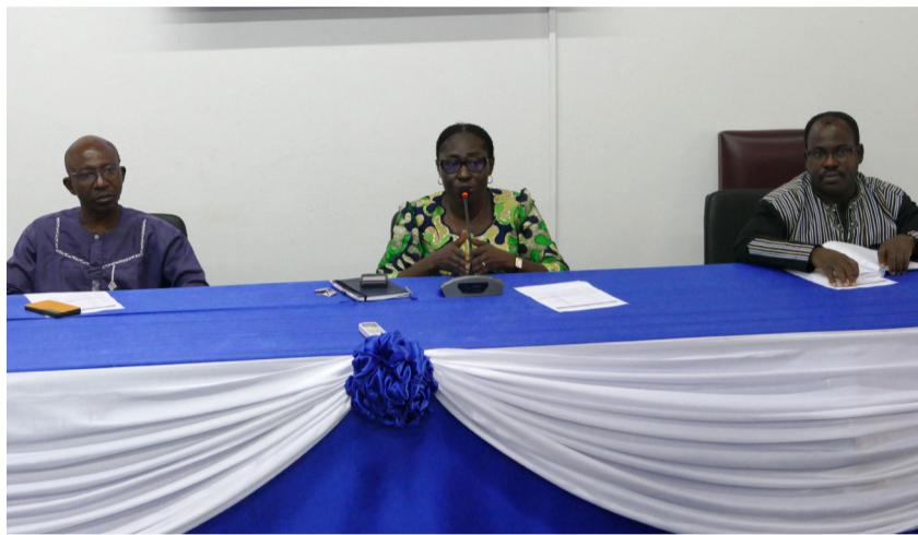
Table officielle lors du lancement des activités de la revue

L'Institut National d'Hygiène (INH) a organisé à Lomé sa revue de direction annuelle portant sur l'année 2024, les 19 et 20 juin 2025 à Lomé. Ce rendez-vous stratégique a réuni les chefs de service, surveillants et leurs adjoints pour une évaluation approfondie de son Système de Management, dans le but d'identifier les axes d'amélioration des prestations de l'institution pour mieux répondre aux attentes de la population.