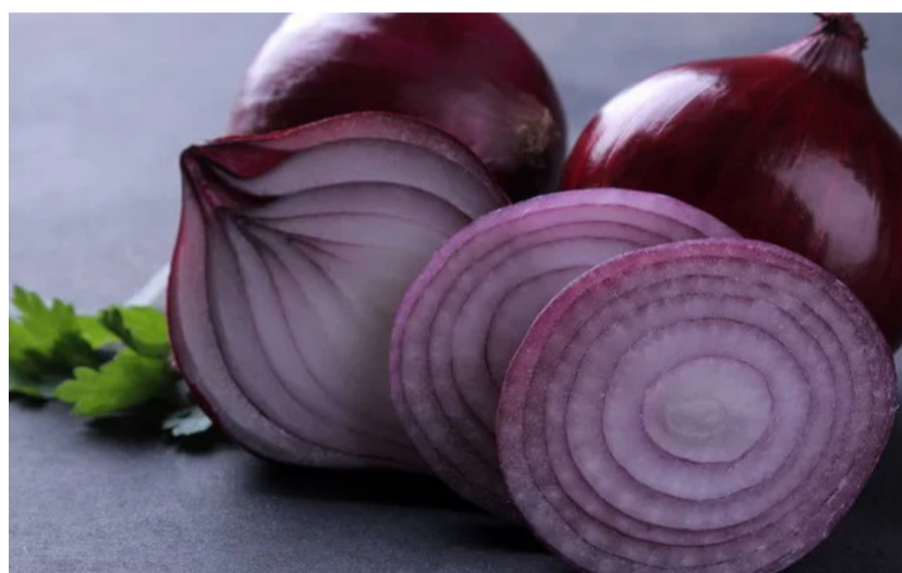
Image des oignons

Une étude cas-témoins menée à Shanghai a révélé que les individus ayant une consommation élevée de l'oignon, avaient un risque réduit de 53 % de développer un cancer de la prostate par rapport à ceux ayant une consommation faible.