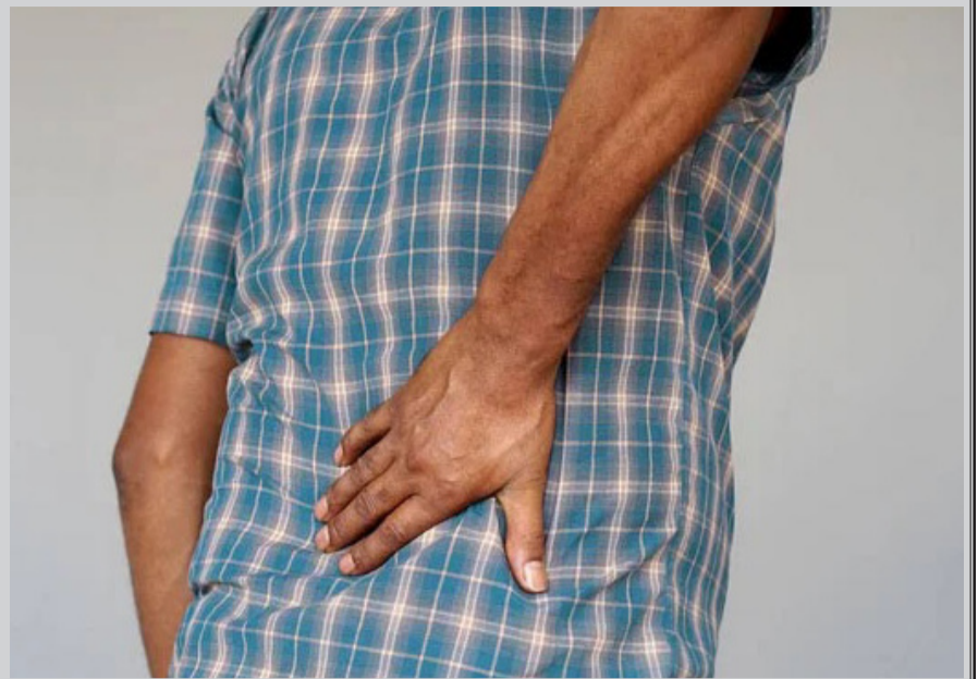
Image d'une personne souffrant du mal de dos

la natation. Toute activité physique qui muscle les quadriceps est à privilégier. En effet, pour le kinésithérapeute, « grâce à la portance de l'eau, les articulations ne subissent pas la pression du corps, tandis que la résistance du milieu aquatique nécessite un effort qui accentue le travail musculaire ». La danse classique n'est pas contre-indiquée. Attention cependant à limiter les exercices demandant de prendre de la force au niveau des genoux.