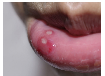
Par Jean ELI

naturels efficaces pour guérir l'aphte : les bains de bouche au bicarbonate de soude, à l'eau chaude salée pour juguler la douleur et l'inflammation.