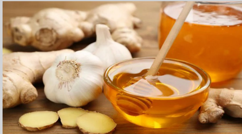
Image d'un composé d'ingrédients pour la circulation sanguine

Une bonne circulation sanguine est vitale pour la santé. Car elle est responsable d'administrer l'oxygène et tous les nutriments essentiels dont ont besoin les organes, les cellules et toutes les parties de l'organisme. Les troubles de la circulation sanguine se produisent à cause de la consommation excessive du gras, du sel, du sucre, de malbouffe, et des effets nocifs des radicaux libres.