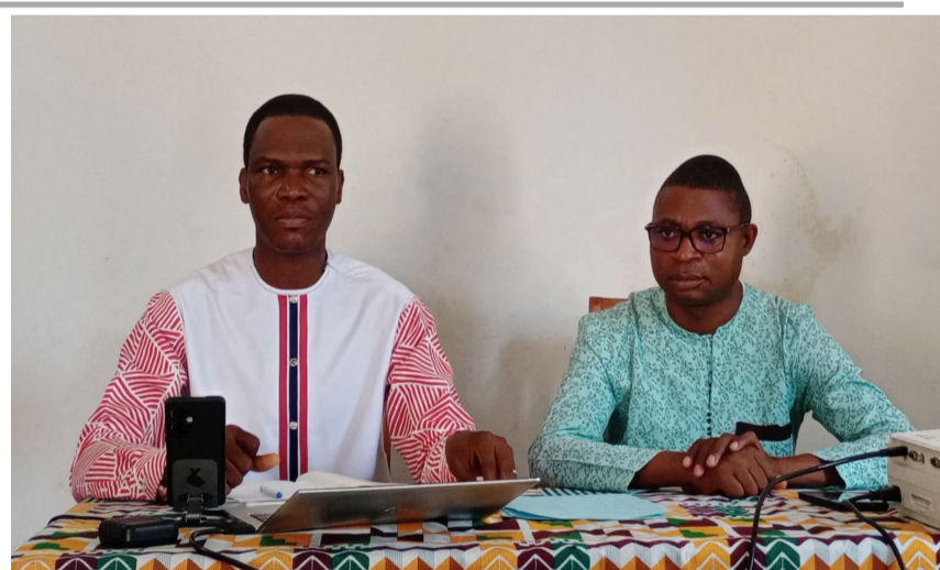
Table officielle lors de l'évènement

L'ATLD compte intensifier les plaidoyers auprès des institutions sanitaires nationales pour obtenir la gratuité du dépistage, notamment pour les jeunes et les femmes enceintes. « Le dépistage doit être gratuit. Si le test n'est pas effectué pendant la grossesse, il faut