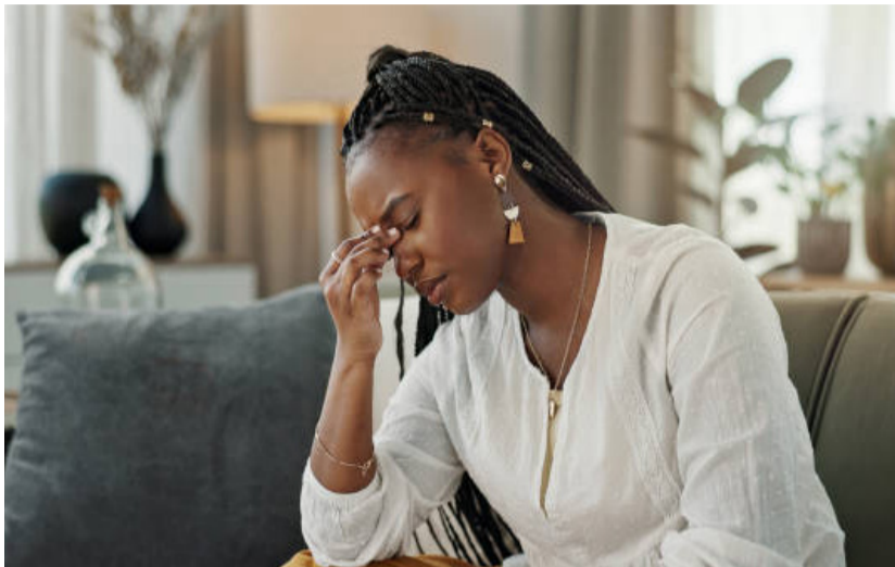
Image d'une femme souffrant des maux de tête

Le mal de tête ou céphalée est une douleur très courante. Pour cette raison, on a souvent tendance à minorer son importance. On attend simplement que cela passe, soit on pioche dans les nombreux médicaments en vente libre ou au mieux on passe à la pharmacie. Mais que peuvent cacher ces maux de tête ?