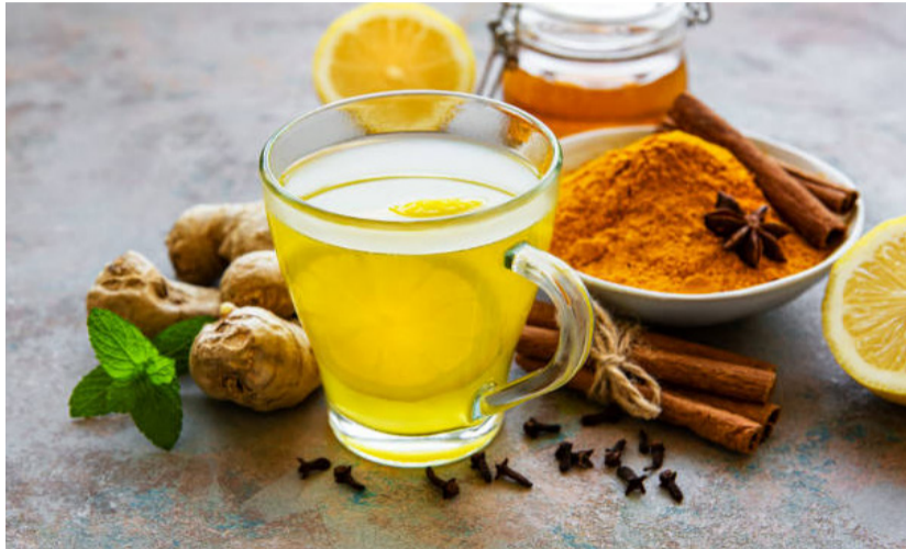
Image d'un remède aux agrumes

Les propriétés des agrumes feront de ce remède un excellent allié pour la santé, que ce soit à titre préventif ou curatif. Les agrumes tels que le citron, l'orange et le pamplemousse permettent de préparer une boisson délicieuse et efficace pour l'énergie et renforcer le système de défense de l'organisme.