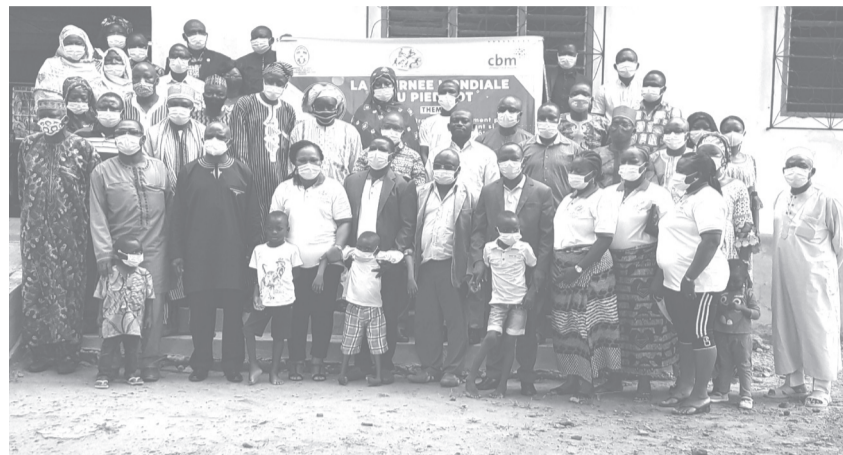
Les acteurs lors du lancement officiel

Les enfants qui naissent avec des malformations, on en connaît au Togo comme partout ailleurs. Le pied bot est une anomalie congénitale. C'est une maladie qui se caractérise par une malformation du pied tourné vers l'intérieur et des orteils pointés vers le bas. Cette pathologie selon les données de l'OMS, concerne 1 à 2 enfants pour 1000 naissances dans le monde. Ce n'est donc pas une fatalité surtout qu'elle se soigne si elle est prise en charge tôt et correctement. Mais à défaut d'un traitement, cette anomalie peut conduire à un handicap permanent. Les structures, les compétences et les appuis pour faire face à cette déficience, le Togo en dispose