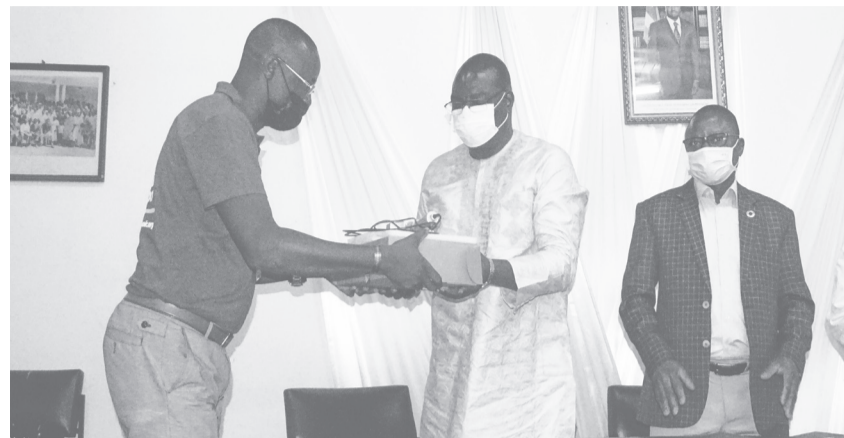
Remise symbolique des équipements

Cette remise de don a été couplée par la signature d'une Convention de partenariat entre le CHU-SO et La Chaîne de l'Espoir pour une durée de trois ans de 2021 à 2024. Ce partenariat a pour objectifs d'abord d'assurer la formation continue des médecins inscrits en