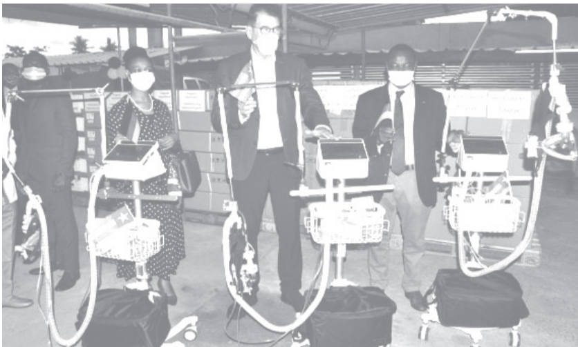
Remise symbolique des respirateurs au ministre Mijiyawa (D)

Le ministre allemand de la Coopération économique et du développement, Dr Gerd Müller a effectué une visite officielle au Togo. À son arrivée le dimanche 13 juin 2021 à Lomé, Dr Müller s'est rendu à l'Institut National d'Hygiène (INH) pour s'enquérir des actions menées dans le cadre de la lutte contre la Covid-19. Là, il a échangé avec le ministre en charge de la Santé, Pr. Moustafa Mijiyawa. Il a offert, au nom de l'Allemagne, 30 respirateurs et 5 000 oxymètres au Togo dans le cadre de la riposte contre la Covid-19.