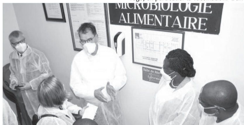
Visite à l'INH